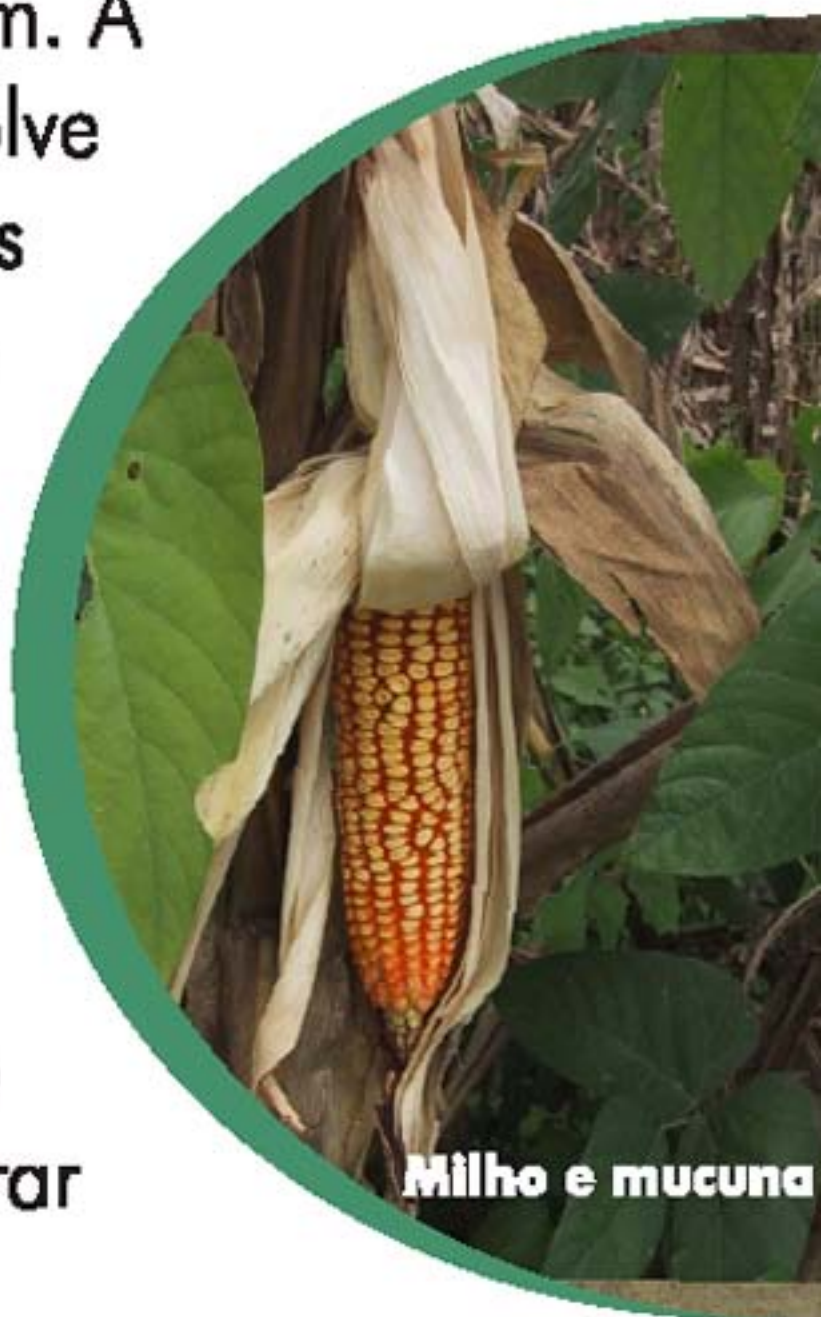
Milho e mucuna

Noutro consórcio de gramínea com leguminosa, uma linha de mucuna é plantada aos 75 dias após a semeadura do milho, nas entre linhas, na densidade de 7-10 sementes/m. A mucuna se desenvolve apoiada nos colmos do milho que pode ser aproveitado tanto para milho verde quanto para grãos. Na colheita do milho para grãos, a espécie de adubo verde vai se encontrar no início do